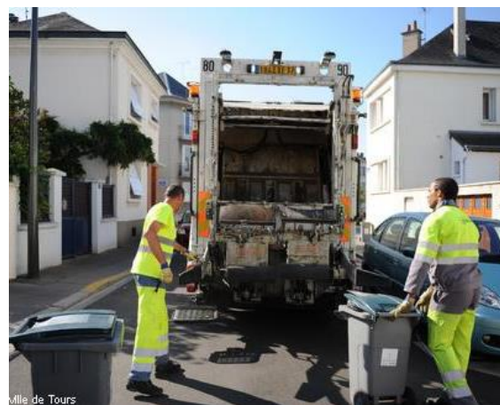
Mairie de Tours