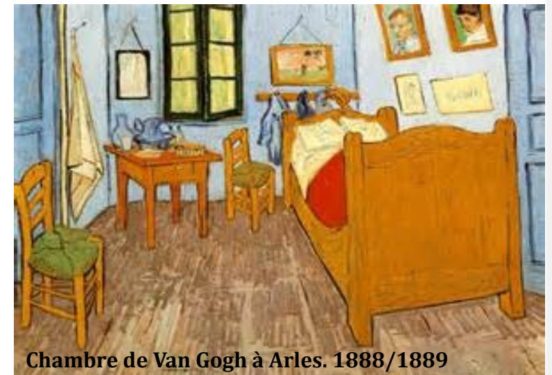
Chambre de Van Gogh à Arles. 1888/1889