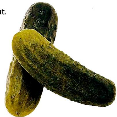
Document 6 : Un cornichon. Il est à la fois acide et salé.

Souvent, les saveurs se mélangent dans un même aliment. Il est alors plus difficile de les identifier.