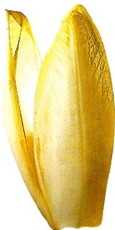
Document 3 : Une endive.