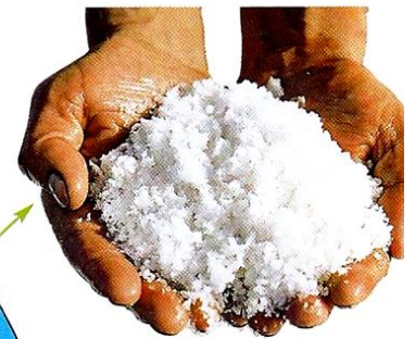
Document 2 : Du sel.