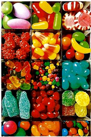
Document 1 : Des bonbons.

Ta langue te permet de percevoir le goût sucré d'une fraise, ton nez de sentir son odeur et tes yeux de voir sa jolie couleur rouge. Tous ces sens te donneront envie de la croquer !