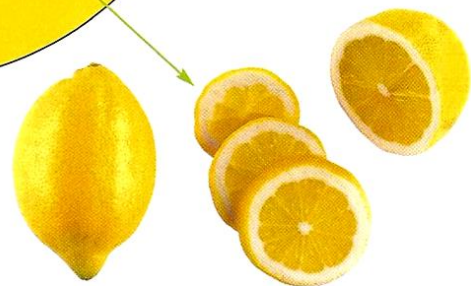
Document 4 : Des citrons.