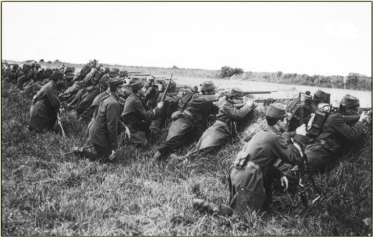
Soldats français embusqués derrière un fossé

Personne n'arrive à percer le front (la zone de combat). Aussitôt, les troupes allemandes creusent des tranchées et s'y terrent pour éviter de reculer davantage. Les troupes françaises font de même. Le front s'établit de la mer du Nord jusqu'au Vosges, sur environ 750 kilomètres. Cette situation va durer quatre longues et terribles années.