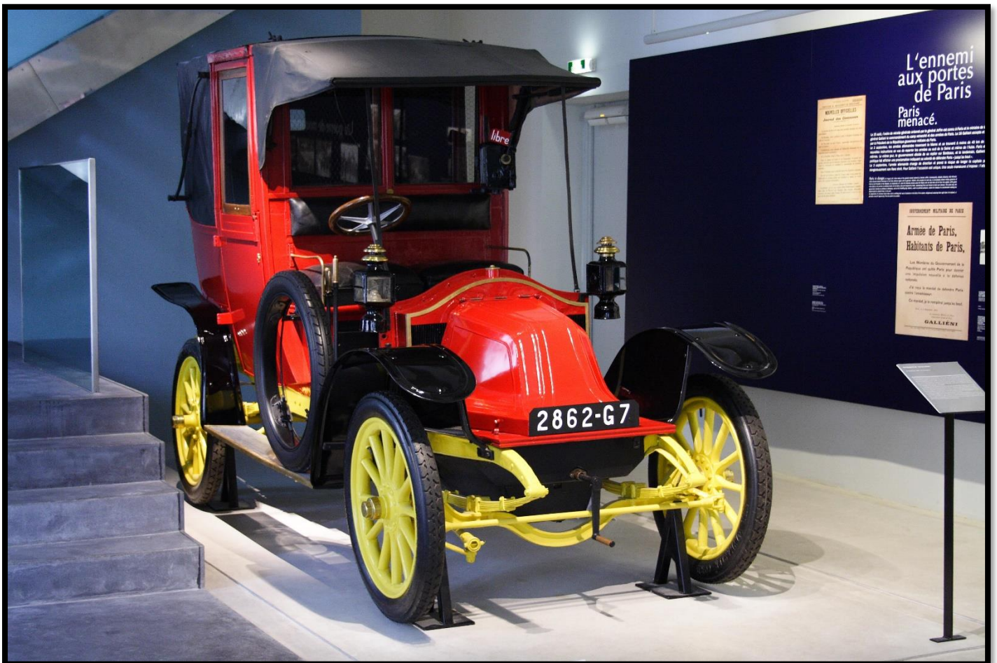
Taxi de la Marne rénové

Les véhicules étaient en majorité des Renault roulant à une vitesse moyenne de 25km/h. Malgré cette vitesse qui nous paraît ridicule aujourd'hui, ce mode de transport permet de gagner du temps. Il fut aussi très cher car les taxis furent payés à leur tarif habituel !