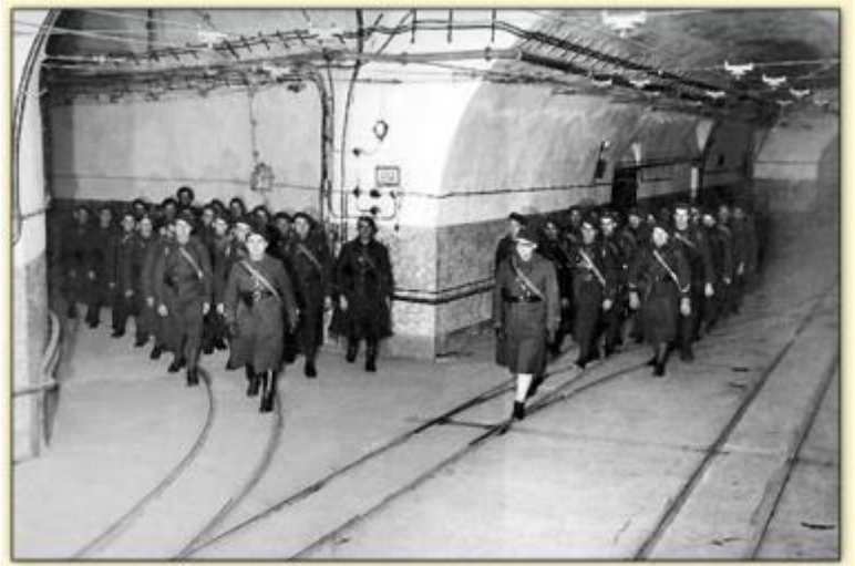
Soldats dans un tunnel de la ligne Maginot