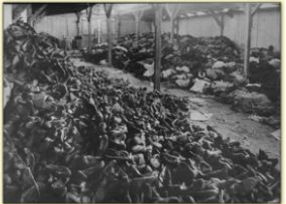
Des montagnes de chaussures et de vêtements