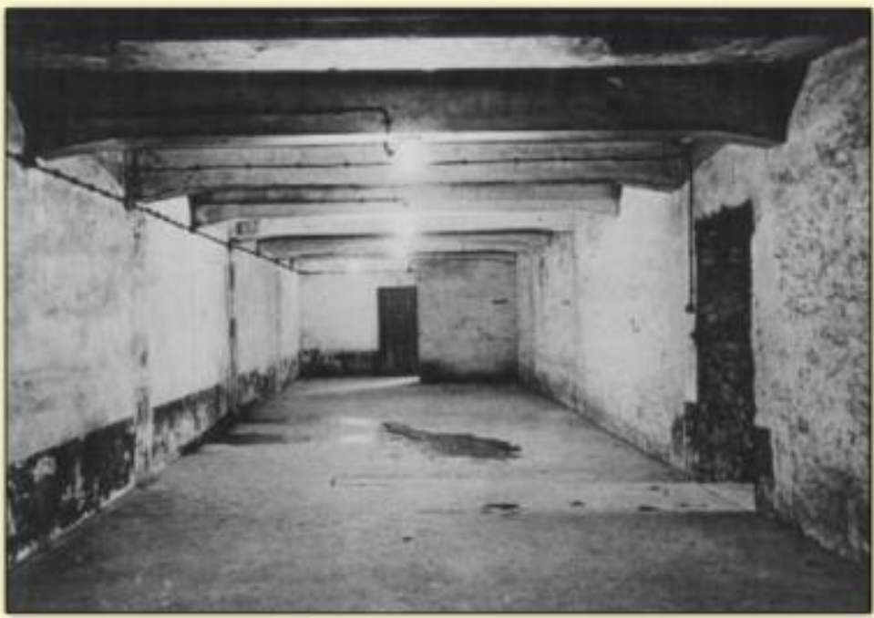
Une chambre à gaz