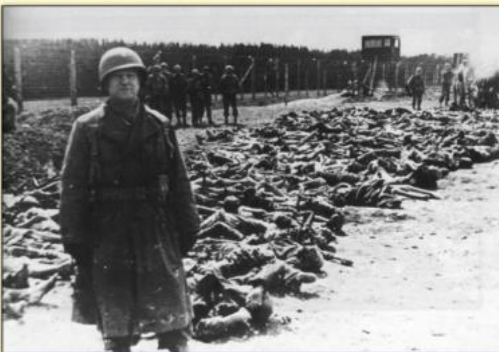
Un soldat américain devant des cadavres à la libération du camp de Dachau le 29 avril 1945 (au fond, d'autres soldats américains)