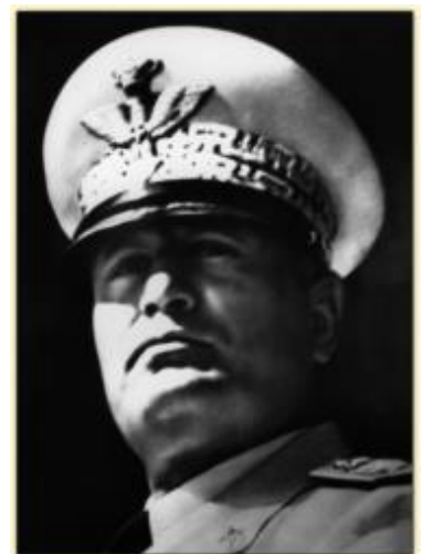
Benito Mussolini, homme politique et dictateur italien

En septembre 1931, l'armée impériale japonaise envahit la Mandchourie, une province de République de Chine, à la suite d'un attentat perpétré contre une voie de chemin de fer appartenant à une société japonaise.