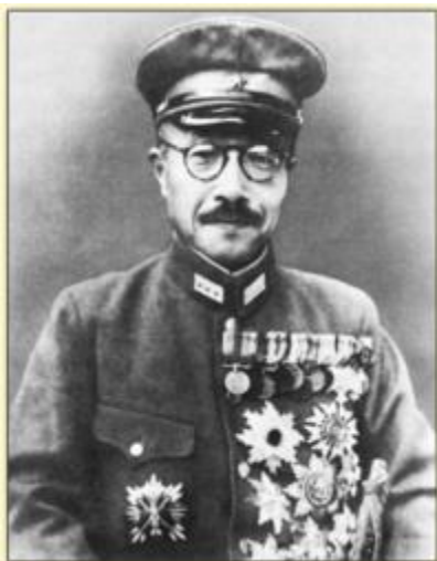
Hideki To-Jo, Premier ministre de l'Empire du Japon de 1941 à 1944

La responsabilité du conflit est attribuée à Hitler ainsi qu'au Japon , qui avait dès 1931 agressé la Chine et attaqué les États-Unis en 1941 (attaque de Pearl Harbor), élargissant alors la guerre européenne à l'ensemble de la planète.