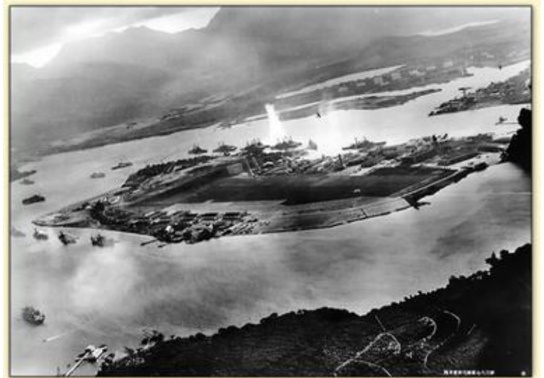
Vue depuis un avion japonais