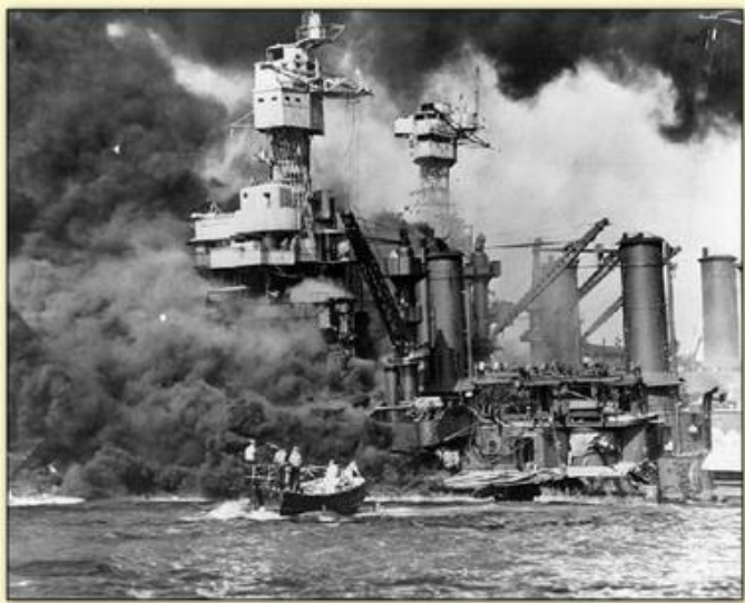
Attaque de Pearl Harbor par les Japonais

Les États-Unis entrent alors en guerre au côté des Russes et des Anglais : le conflit devient mondial.