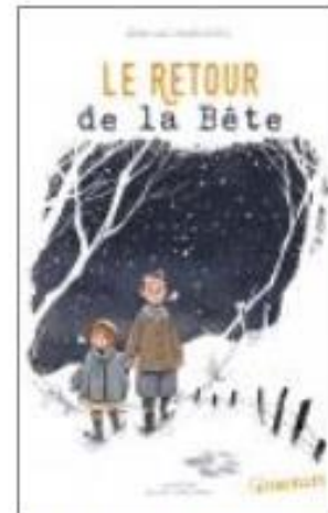
Le retour de la bête