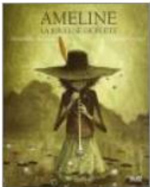
Ameline, joueuse de flûte