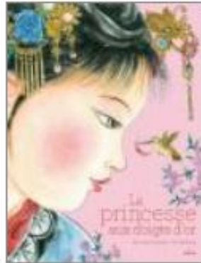
La princesse aux doigts d'or