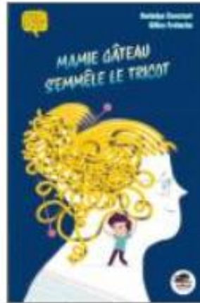
Mamie Gâteau s'emmêle le tricot