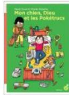
Mon chien, Dieu et les Pokétrucs