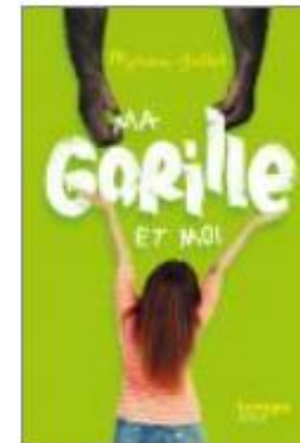
Ma gorille et moi