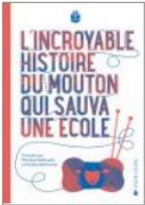
L'incroyable histoire du mouton qui sauva une école