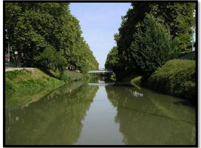
Le canal du Midi, aux environs de Toulouse

Il réorganise les finances de l'État et essaie de limiter les dépenses extravagantes du roi pour la cour et la guerre. Il diminue la taille, un impôt lourd qui frappait les paysans, mais augmente les taxes sur les produits de luxe : tabac, vin, café, cartes à jouer.