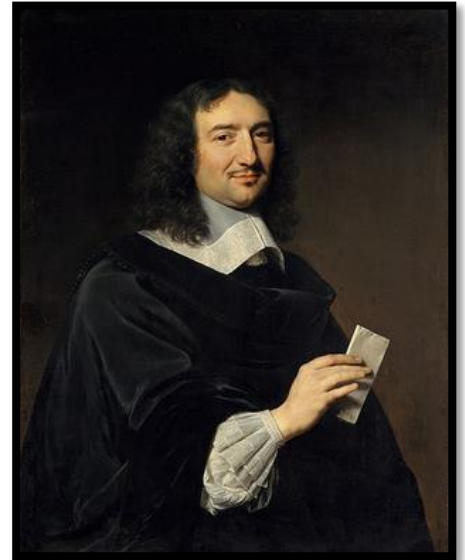
Colbert en 1655