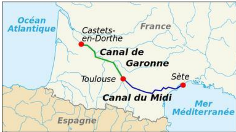
Le canal du Midi relie la Garonne, à Toulouse, au port de Sète, sur la mer Méditerranée.