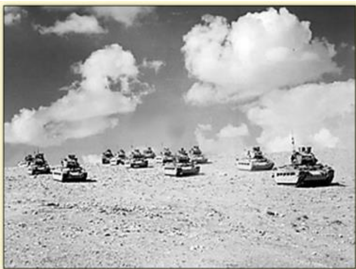
Chars anglais à l'assaut des forces allemandes dans le désert africain