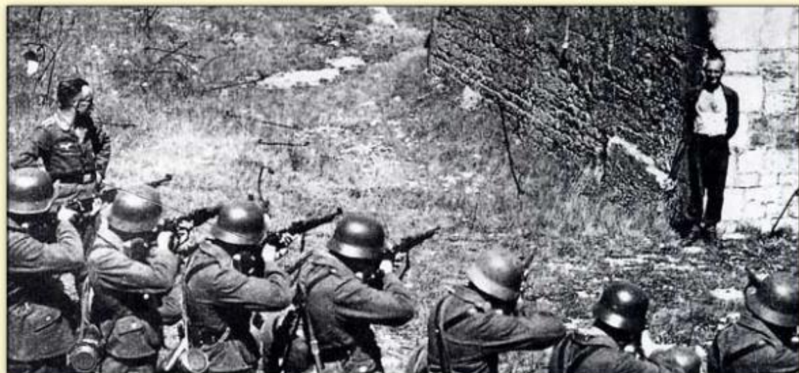
Les résistants paient de leur vie leur engagement quand ils sont arrêtés par les Allemands.

Une figure de la résistance parmi tant d'autres : Jean Moulin https://fr.wikidia.org/wiki/Jean_Moulin