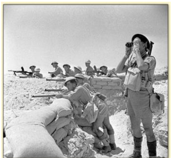
Soldats britanniques à El-Alamein