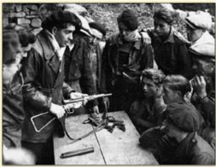
Résistants maquisards apprenant à manier les armes

Les Résistants commettent des sabotages, attaquent les convois, fournissent des renseignements aux Alliés.