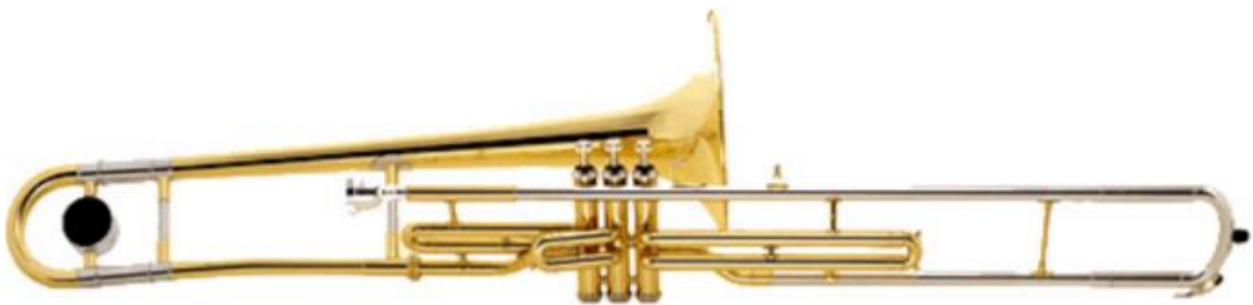
Trombone à pistons

Le son du trombone est plus grave que celui de la trompette. C'est normal, il est plus gros !